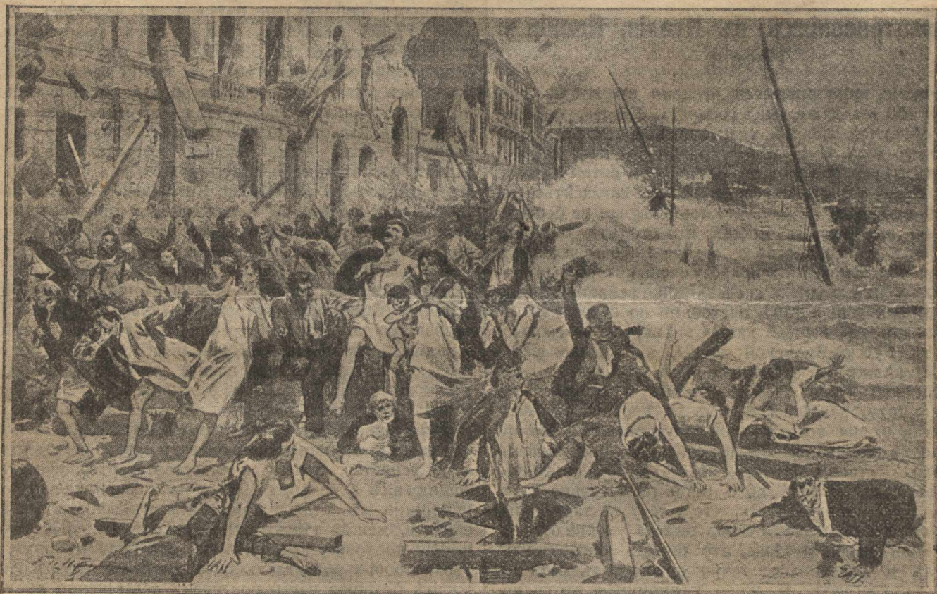
Землетрясеніе въ Мессинѣ.

Мирно дремалъ итальянскій городъ Мессина. Лѣниво плескали о берегъ сонныя волны. Сладкимъ сномъ покоились жители. Былъ ранній часъ утра понедѣльника 15 декабря только что минувшаго года, когда надъ не подозрѣвавшимъ никакой бѣды горо-